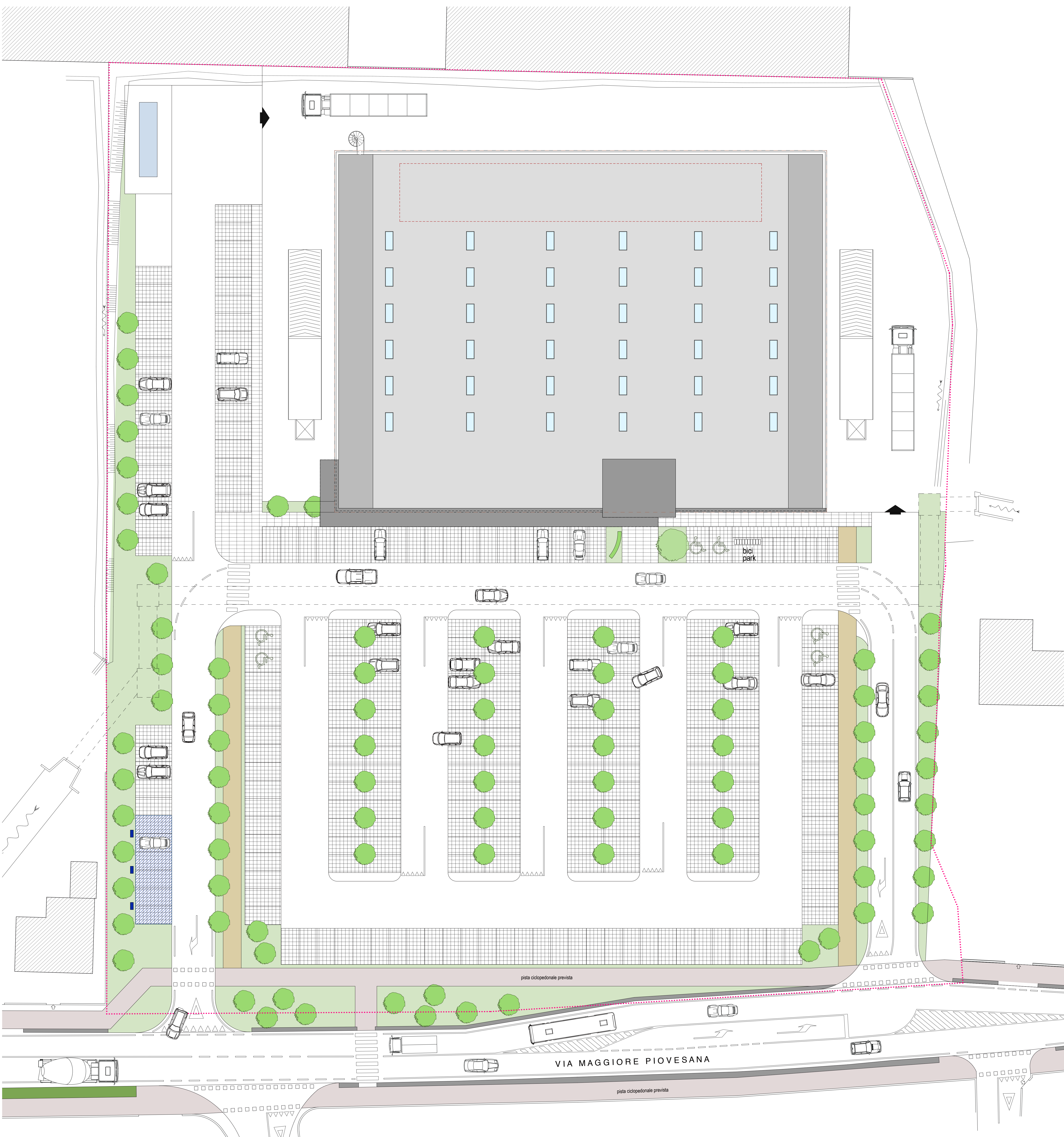
PLANIMETRIA COPERTURA CON COROGRAFIA SCALA 1:200